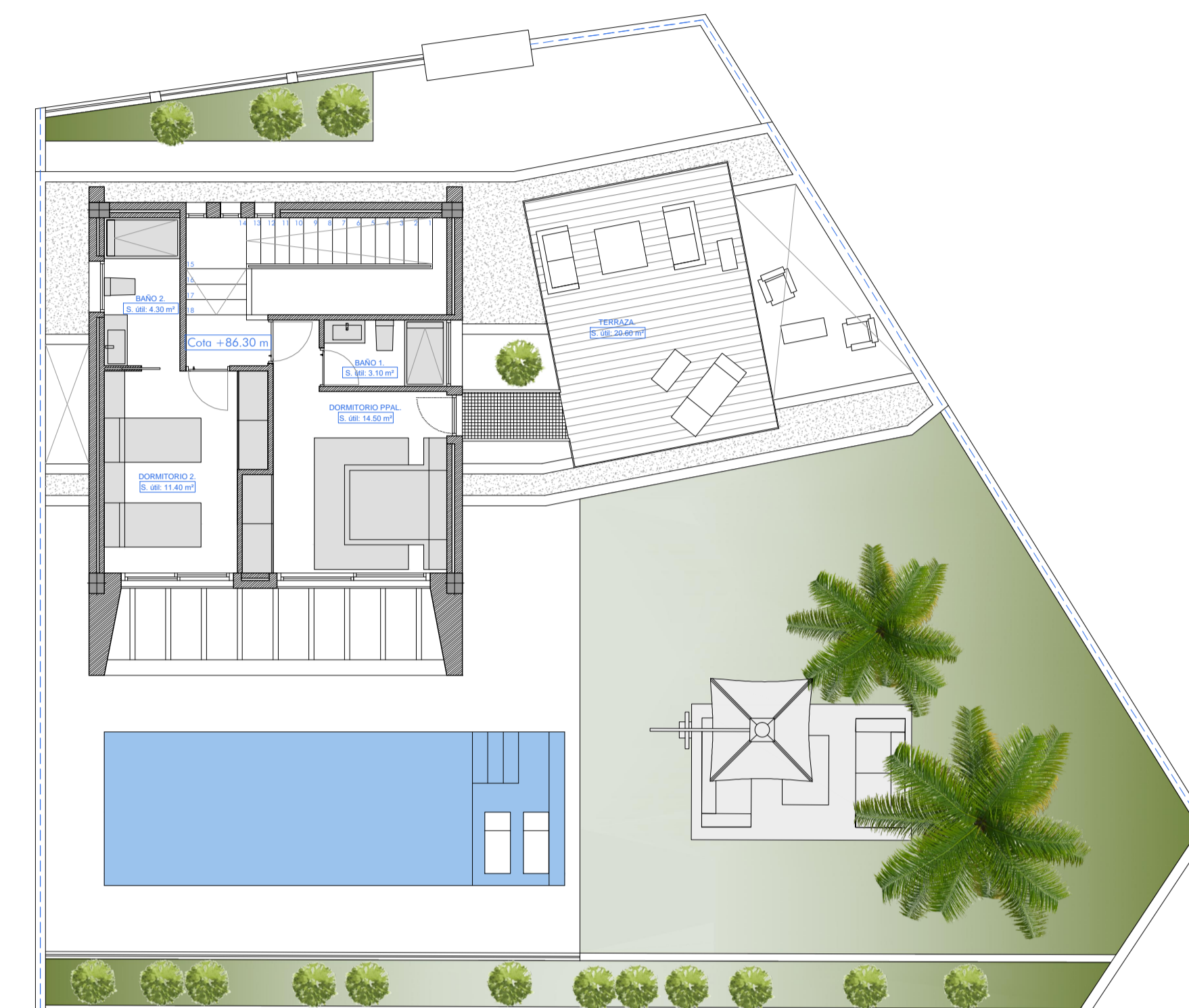
PLANTA PRIMERA: Superficie construida: 43.50 m²