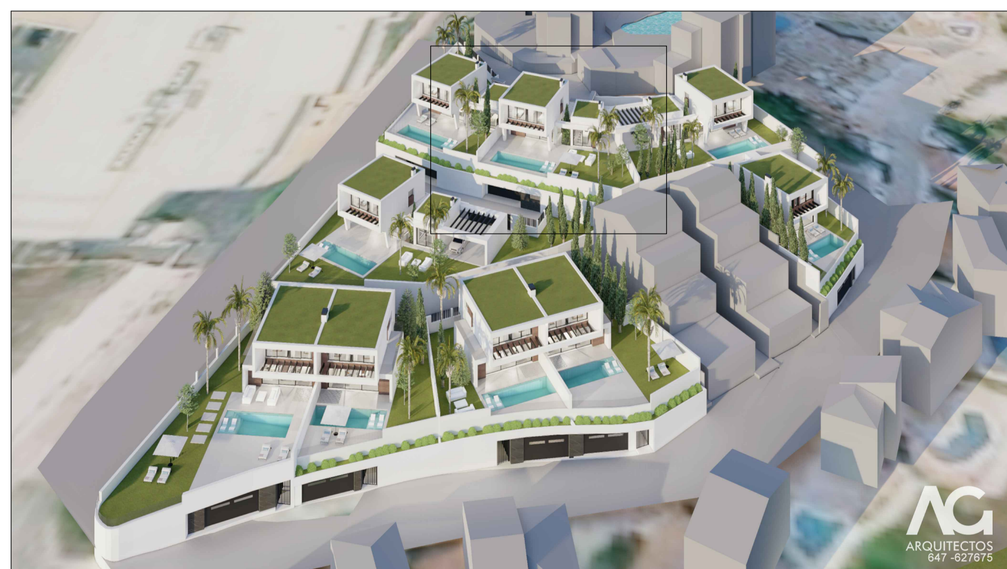
IMAGEN DE CONJUNTO.