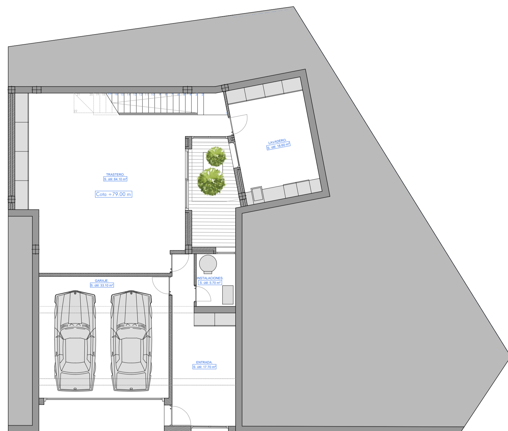
PLANTA SÓTANO: Superficie construida: 159.00 m²