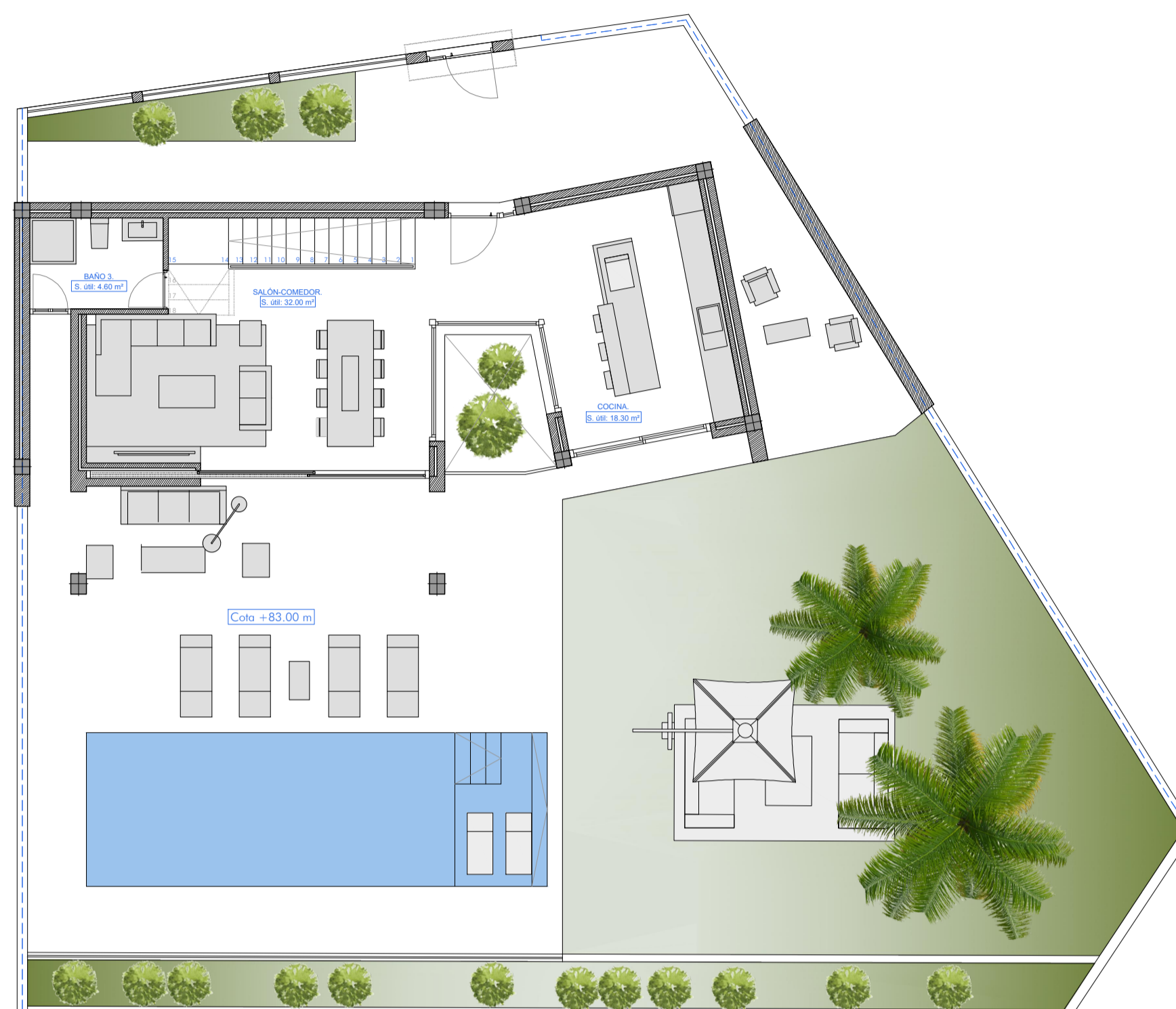
PLANTA BAJA: Superficie construida: 66.10 m²