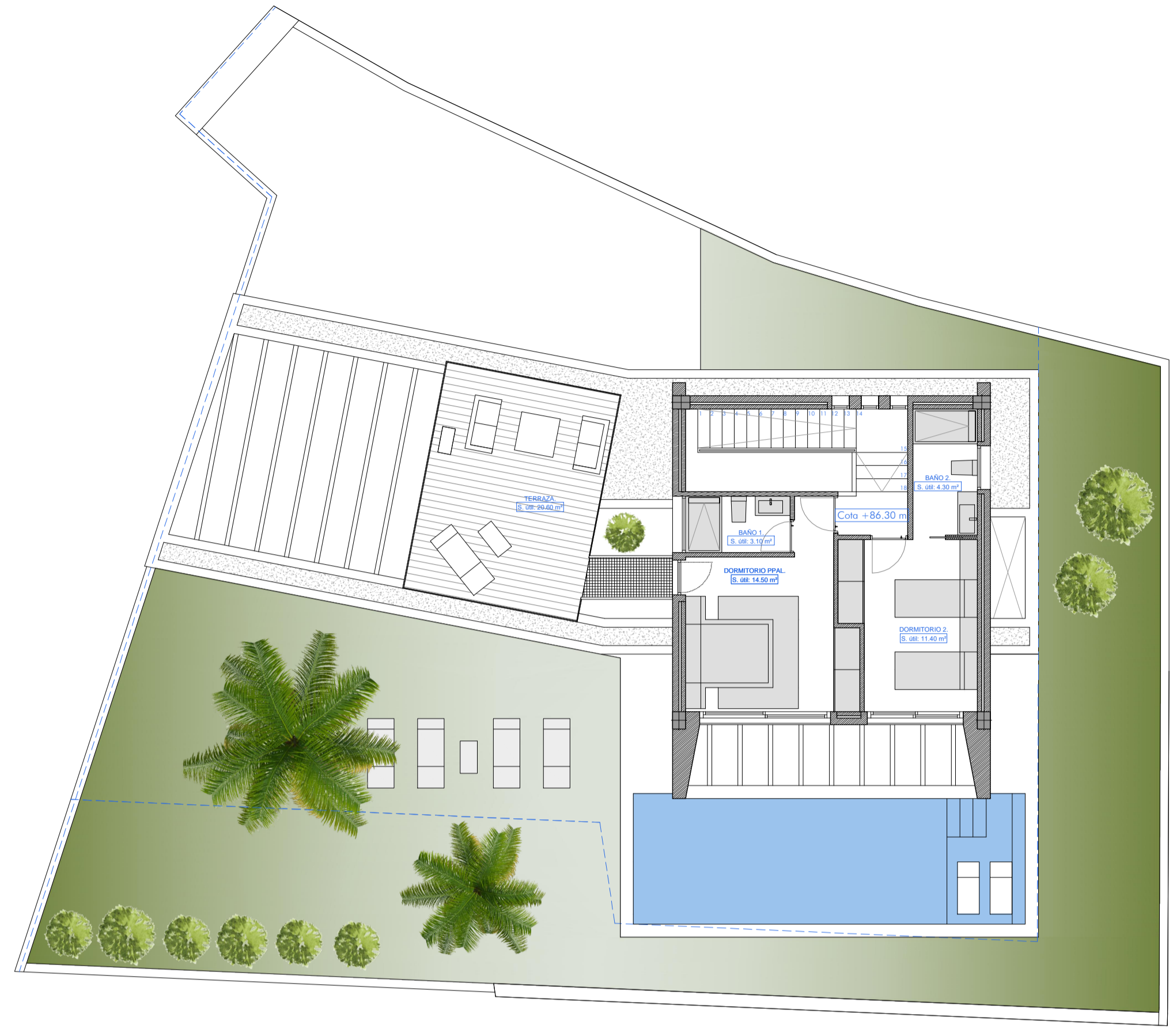
PLANTA PRIMERA: Superficie construida: 43.50 m²