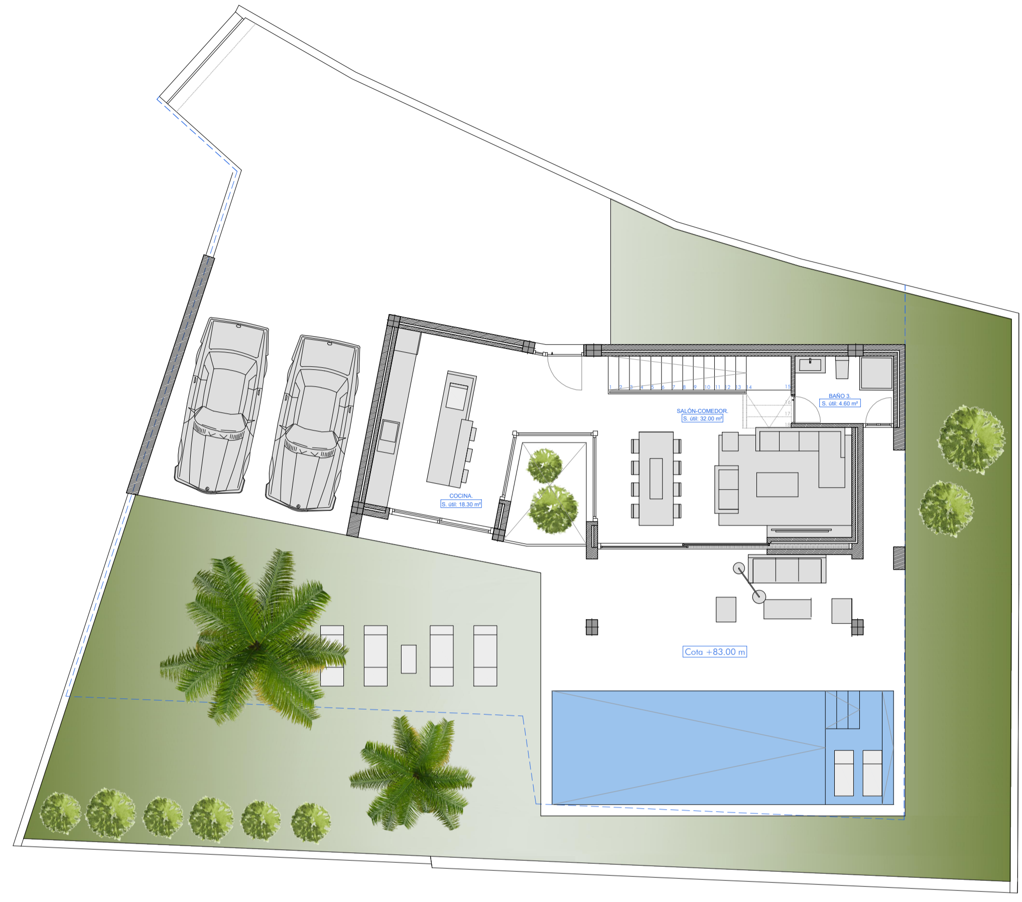
PLANTA BAJA: Superficie construida: 66.10 m²