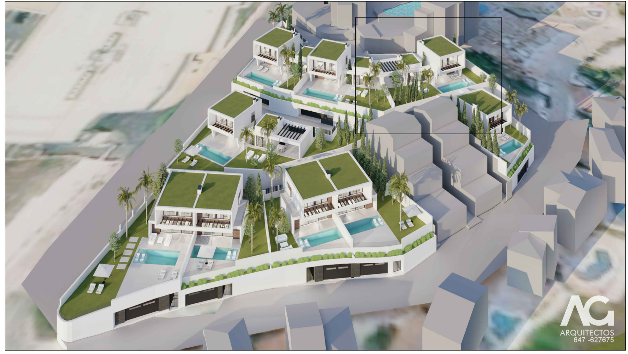
IMAGEN DE CONJUNTO.