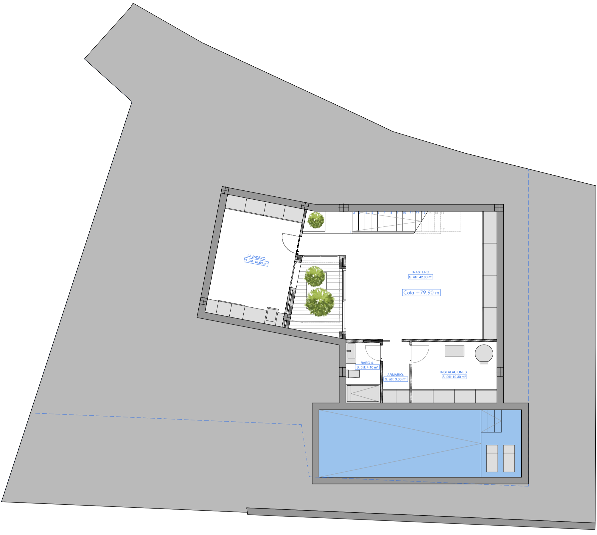
PLANTA SÓTANO: Superficie construida: 93.80 m²